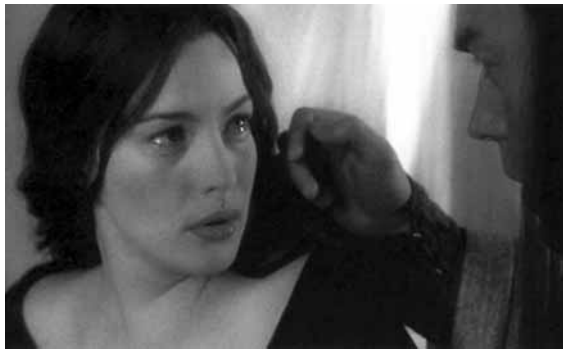
Arwen, l'esposa d'Aragorn, segons la pel·lícula de Peter Jackson.

temps. 2 En qualsevol cas, Jackson va filmar dues seqüències, pràcticament sense paraules, en què Faramir i Éowyn, convalscent de les respectives ferides, es miren, s'agafen de la mà i s'abracen. Ens hem perdut el treballat diàleg sentimental-terapèutic de Tolkien, però almenys se'ns diu què passa. I no se sap per quins set sous no hi ha petó: l'únic petó de tot El senyor dels anells , un petó amorós, atorgat «davant de la mirada de molts» ( LOTR , 3: 214). És per això de «la mirada de molts» que els guionistes l'han desplaçat a l'escena ja esmentada de la coronació, fent que Aragorn, en un final enutjosament tòpic, besí apassionadament Arwen en públic quan aquesta apareix per sorpresa amb la comitiva dels elfs? 3