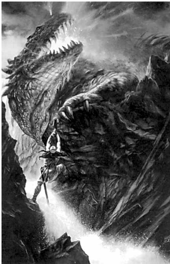
L'heroi maleit Turin mata el drac Glaurung, segons el relat d' El Silmaril·lion .