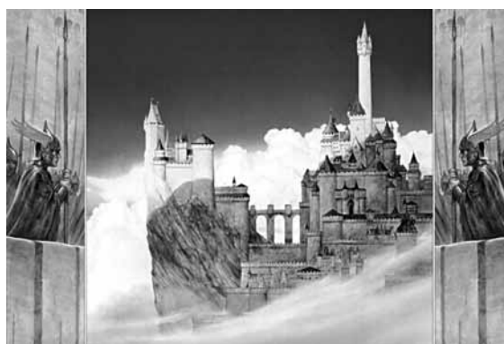
Vista de la ciutat de Minas Tirith, capital del regne de Gondor.

«No sou pas gasiu, Éomer» va dir Aragorn, «cedint així a Gondor, la cosa més bella del vostre reialme!» Aleshores Éowyn va mirar Aragorn al ulls, i va dir: «Desitjeu-me felicitat, senyor i guardador meu!» I ell va contestar: «Us vaig desitjar felicitat des del primer moment en què us vaig veure. La benedicció que avui veig en vós dona consol al meu cor» ( LOTR , 3: 225).