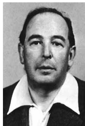
C. S. Lewis, membre dels Inklings.

Tolkien no compartia al peu de la lletra les opinions de C.S. Lewis: la dimensió matrimonial, i per tant sacramental, de la seva concepció de l'amor l'apartava d'entusiasmes idealitzadors, sigui aplicats a la interpretació