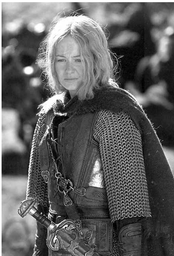
La donzella guerrera Éowyn, que s'acaba casant amb Faramir, sensecal de Gondor.

de Rohan, quan Gandalf desfà l'encanteri que el mantenia sotmès a la voluntat del Grima, l'agent de Saruman, el traïdor. Oncle i neboda surten a la llum del sol i Aragorn la veu: bonica, alta i prima, majestuosament vestida de blanc i d'argent, amb els cabells com un riu d'or. La impressió que li fa és d'una noia freda i dura, gairebé un infant. I aleshores ella se'l mira a ell: alt, d'estirp reial, savi, carregat d'anys i portador d'un poder ocult ( LOTR , 2: 104). Sabem que ella s'enamora perdudament i ell no; el text ho suggereix, però com que la presència femenina és tan escassa a El senyor dels anells i, com que quan hem vist Arwen, la seva mirada perfora el cor de Frodo i no pas el d'Aragorn, que està conversant tranquil·lament al seu costat (vegeu el punt b del quadre anterior, citat més amunt, a LOTR , 1: 228), el lector té tot el dret de dubtar. I continua despitant el fugisser contacte de mans entre Éowyn i Aragorn. Som de nou a Meduseld, i Éowyn, com la reina Walto del Beowulf , honora els guerrers un per un fentlos beure de la mateixa copa on ha begut el rei, que ha recuperat el pòndol del govern ( LOTR , 2: 111). Per