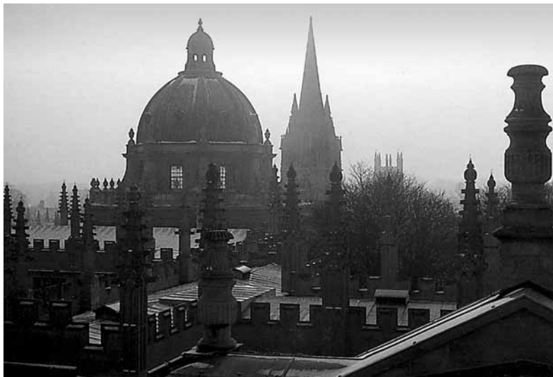
Panorama del centre històric d'Oxford.

L'atracció eròtica no encaminada a un matrimoni fecund és un fenomen aliè al món mític i heroic d' El hobbit i d' El senyor dels anells , i ho és de forma deliberada i conscient. Només cal pensar que les figures més populars, com Bilbo i Frodo Baggins, oncle i nebot, són solters i no se'ls coneix cap relació femenina. El polifacètic i entranyable Gandalf, des d'aquest punt vista, presenta un perfil sacerdotal, com si l'orde dels mags, al qual també pertany Saruman, imposés el celibat. 5 Si considerem la gènesi de les dues obres de ficció, l'asexualitat dels protagonistes té alguna cosa a veure amb el fet que Tolkien va començar a escriure per a un públic juvenil. 6 En canvi, els materials mitològics i heroics d' El Silmaril·lion contenen algunes històries passionals força tèrboles. El fet és que des del moment que els hobbits d' El senyor dels anells entren en contacte amb Strider-Aragorn, Tolkien va trobar-se a les mans una trama amorosa, especialment quan va «descobrir» que el misteriós personatge que coneixem a l'hostal de Brie era l'hereu d'Isildur —el rei que uns