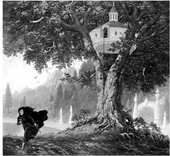
Lúthien fuig de la presó on l'ha tancada el seu pare i va a auxiliar el seu enamorat, Beren.

Però la història de Lúthien i Beren multiplica els estímuls i s'hibrida amb la rondalla d'Amor i Psique i amb la història d'Orfeu —el Sir Orfeo situa aquesta darrera al cor de les lletres angleses de la baixa Edat Mitjana—, 7 per donar lloc a un nou mite: el de la parella d'enamorats heroics que, a través del socors mutu, aconseguen de rescatar un tresor extraordinari, una mica també a la manera de Walter i Hildegunda al poema llatí Waltharius (segles IX-X), escrit a partir de relats orals germànics. 8 El pare de Lúthien, per desanimar Beren, li proposa que li porti, com a regal de casament, un dels silmarils, els joiells màgics que pesen sobre el destí dels elfs. El jove desafia, a