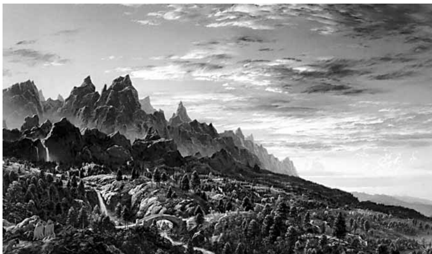
Els boscos d'Ithilien, on Frodo va trobar Faramir.

per venjar o salvar Theoden» ( HOME , VII: 448). Tolkien encara no havia acabat de triar el nom del germà d'Éowyn i fer-la morir en combat li semblava una solució acceptable per al problema del seu amor per Aragorn, que havia esdevingut impossible.