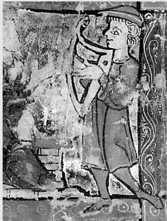
Un trobador toca l'arpa (British Library, Londres).

blar amb ulls moderns una imatge poc dibuixada, farcida de tòpics, però l'èxit que va tenir crec que apunta a una creació deliberada, que va permetre a la posteritat de fer-ne una lectura molt concreta. El Pere cortès i cavaller té sentit com a senyor occità, i així el sol fet de tenir poesia dedicada (independentment del contingut), de tenir un trobador al seu servei, ja hi contribueix: encara més si té producció pròpia. Però, igualment important és el marc que proporciona la propaganda gibel·lina per a una imatge basada en l'oposició a Carles: és aquí on se situa el famós desafiament de Bordeus, i la lectura cavalleresca que en farà la posteritat. Així, aquesta imatge a la qual van col·laborar trobadors i cronistes va passar al terreny mític i va fer perdurar la fama literària de Pere, fins a arribar al Curial i més enllà. No és sorprenent que el mite del cavaller i cortès rei Pere arrelés en la literatura catalana com explica Turró (2004) i també en la italiana (a la Commedia , al Decameron ), amb alguna excursió posterior a l'anglesa, sota la disfressa de Don Pedro a Much Ado About Nothing : són, en definitiva, els descendents de l'antiga aliança gibel·lina. No cal dir que, els autors francesos, hereus dels angevins, no van ser gens sensibles als encants heroics de Pere el Gran.