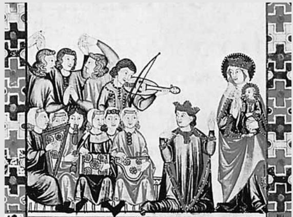
Alfons el Savi escolta els músics i canta una de les seves cantigas a la Mare de Déu (Biblioteca del monestir de El Escorial).