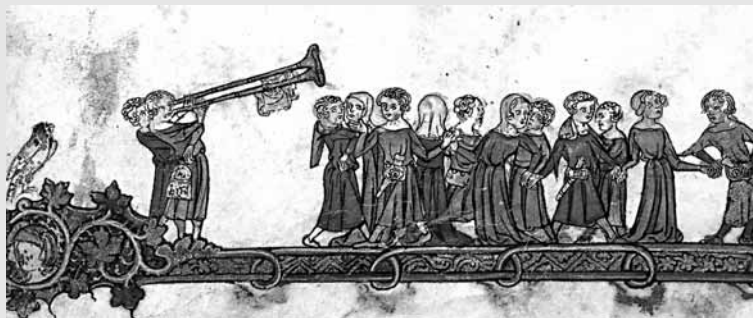
Representació d'una dansa cortesana (Koninklijke Bibliotheek, La Haia).

Un altre indicatiu que Cerverí ja era trobador, i conegut, abans d'entrar al servei de l'infant Pere ens el proporciona la Recepta de xarob . El poema és una lloança als Cardona en forma d'aventura al·legòrica. Cerverí, mentre cavalca entre Palà i Torroella (és a dir, prop de Cardona), tot pensant en una nova dansa que té a mig fer, es troba amb Cortesia que plora i s'esquinça les vestidures. La causa de la seva desesperació, li acaba confessant, és que la seva germana Amor està agonitzant. Cerverí se sobreposa de l'esglai d'aquesta situació, tan dramàtica per a tots els cortesos i fins amants, i recepta a Amor un xarop fet amb les qualitats de tot un seguit de dames nobles, encapçalades per la vescomtessa de Cardona. Donada la seva singularitat dins del corpus conservat, crec que aquest poema ha de ser un vestigi de la poesia dedicada als Cardona. S'ha de datar en qualsevol cas abans de 1262, perquè em sembla impensable que un trobador, ni que fos al servei dels Cardona, fes un homenatge a les dames catalanes sense esmentar la muller de l'hereu a la corona. I si això és així, tenim en aquesta època un poema on Guillem de Cervera ja es deia Cerverí, feia «dansetes novelles» i tot passejant pels volts de Cardona, una personificació al·legòrica, Cortesia nogensmenys, el podia reconèixer com a tal i ell, en la figura de Cerverí el trobador, podia convertir-se en el metge d'Amor.