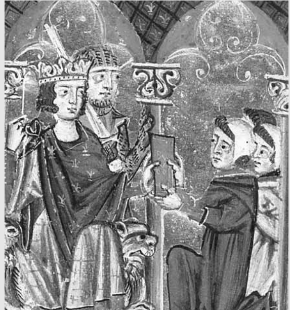
Carles d'Anjou rep un regal dels emissaris de l'emir de Tunis (Biblioteca Nacional, París).

tors, però, més estesos a l'obra de Cerverí que no sembla a simple vista: hi ha més poesia política i és un element present en la que no ho és pròpiament.