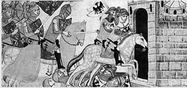
El rei Manfred de Sicília, perseguit per Carles d'Anjou, es refugia a la ciutat de Nàpols.

Tots aquests fets deixen rastre, d'un manera o altra, en l'obra de Cerverí. Començaré per un moment històricament significatiu, i potser també significatiu en la relació entre el trobador i l'infant: el viatge de Pere el Gran a Castella, l'únic moment on Cerverí apareix documentat fora de l'entorn gironí.