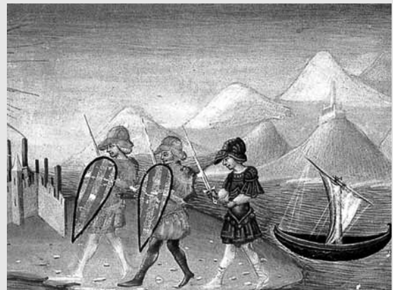
Els catalans desembarquen a Sicília (British Museum, Londres).

Llavors, quin servei ofereix Cerverí a Pere un cop