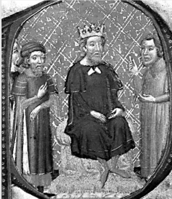
Representació de Pere el Gran al moment de concedir els privilegis de Barcelona, en una caplletra del Llibre verd.

cortès. Quan arriba a rei, Cerverí prodiga els bons auguris per al regnat i sovint posa èmfasi en la capacitat de Pere per «dur a terme les empreses».