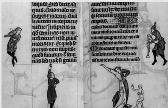
Joglars representats en un llibre d'hores (British Library, Londres).

A l'entorn de Pere el Gran (1240-1285; va accedir al tron el 1276), com al de tots els reis de la casa de Barcelona des de finals del segle XII, és habitual la presència de joglars i trobadors. Cap d'aquestes figures, però, hi apareix amb la persistència del trobador Cerverí de Girona, ni cap ens dóna tants indicis per dibuixar la política cultural del seu moment. L'obra poètica conservada de Cerverí està íntimament lligada a la figura de Pere el Gran en un grau difícil d'igualar entre els poetes de cort catalans o entre els trobadors. És una relació que es percep a simple vista: encara que la documentació d'arxiu no confirmés un servei de vora vint anys, les referències constants en l'obra poètica del trobador ja proclamen una relació continuada i estreta.