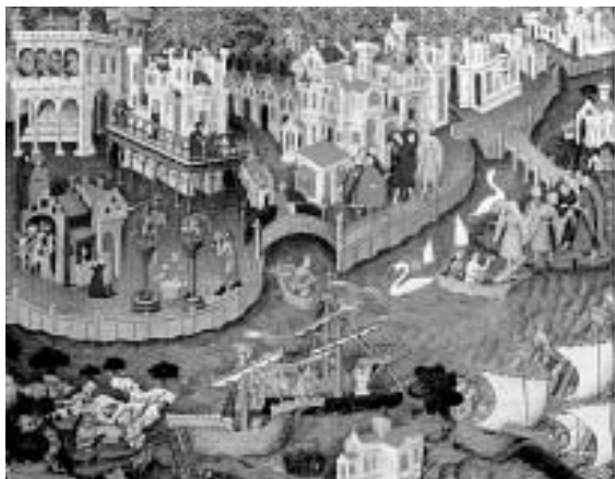
Naus a punt de salpar del port de Venècia (Marco Polo, Li Livres du Graunt Caam , Oxford, Bodleian Library).