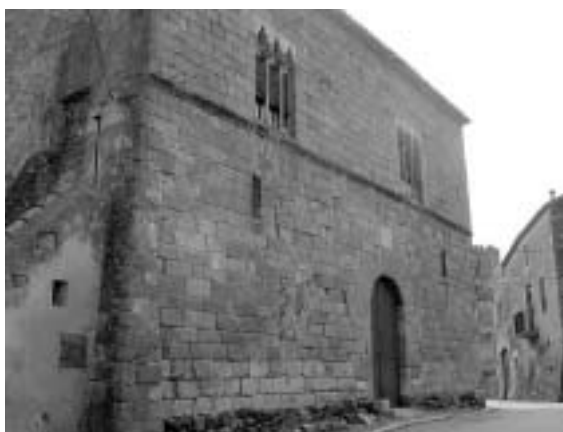
La Casa Gran de Castelló d'Empúries (carrer Portal Nou), un exemple de casa nobiliària del segle xv, semblant a la que devien tenir els Vilagut i els Tinter en aquesta mateixa vila.