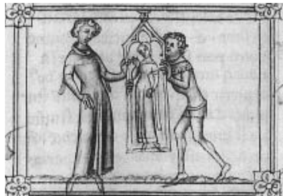
L'enamorat contempla el retrat de la dama (Guillaume de Machaut, Le voir dit , París, Bibliothèque Nationale).

Això és precisament el que veiem en el Vilagut poeta: la competència poètica que li havia proporcionat la seva formació, al servei d'una peça perfectament adequada a la moda del moment. És impossible fer una anàlisi més detallada d'un fragment tan breu. A la cançó conservada, segurament hi falten un bon nombre de versos i només podem deduir que es tracta d'un elogi a una dama, que és la millor de totes i que té un punt de virtut terapèutica quan se la contempla. No és un tema gens innovador ni sembla que pertanyi a una peça d'un valor literari massa elevat, però sí que encaixa perfectament amb la teoria contemporània sobre l'amor. Hi reconeixem les formulacions i l'estil de la lírica que es feia en el regnat del Magnànim abans que l'obra d'Ausiàs March il·luminés la resta de poetes amb una nova expressió lírica.