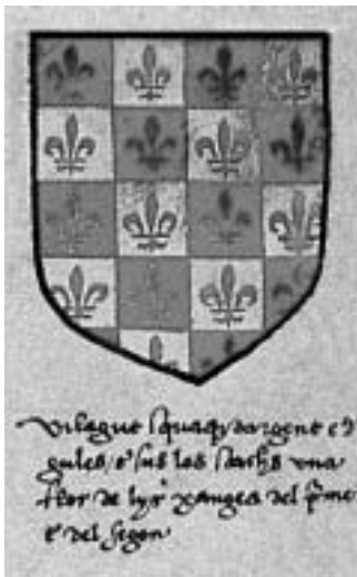
Escut d'armes dels Vilagut, segons l'armorial de Salamanca. En el text es pot llegir: «Vilagut, squaque d'argent e de gules e sus les scachs una flor de lyr xangea del primer e del segon».

mil sous barcelonins per al manteniment de la infermeria, que havia estat construïda amb deu mil florins del testament d'un altre català, l'antic Mestre Antoni de Fluvià, mort el 1437. L'orde, en agraïment, va fer marcar a la vaixela i a la roba d'aquesta infermeria les armes de Joan de Vilagut. Aquesta marca es va mantenir fins i tot quan l'orde es va traslladar a Malta (Nicolaou d'Olwer 1926). Amb tot, sabem gràcies a la documentació que el 1467 els cent mil sous barcelonins no estaven completament pagats i el rei Joan II feia gestions per tal que la Castellania acabés de pagar aquests diners al Convent.