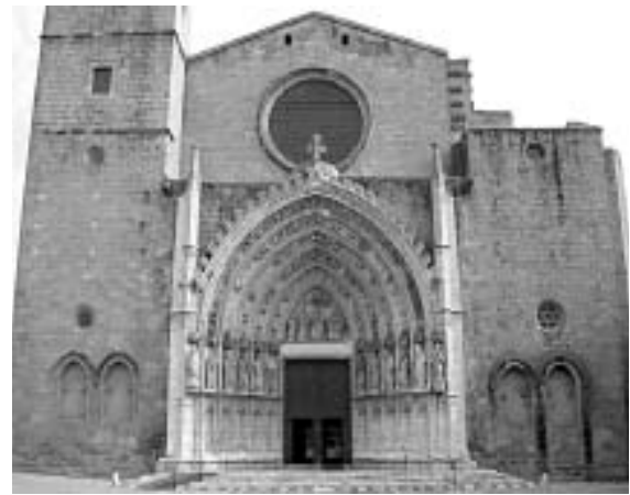
Façana de l'església catedralícia de Castelló d'Empúries. La família Vilagut i la família Tinter eren originaris d'aquesta vila empordanesa.

té molts deutes amb la Divina Comèdia de Dante. Són obres que denoten una vida cultural activa a Castelló, amb una producció variada que incorpora els diversos estaments i abraça tot l'arc cronològic medieval.