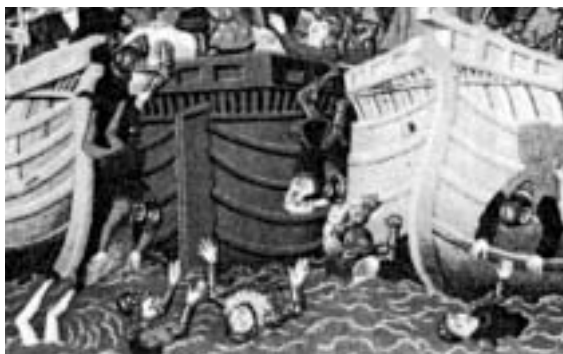
Detall dels ofegats en un combat naval del segle XV (Cambridge, Fitzwilliam Museum).