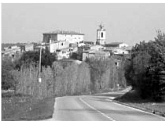
Sant Mori, d'on destaca el castell propietat de la família Vilagut. El castell fou reformat al segle XV i perdé el seu aspecte defensiu per passar a tenir un aspecte de palau nobiliari.

de dels cavallers de Sant Joan de Jerusalem, que, un cop traslladats a aquesta illa del Mediterrani al segle XVI, es van anomenar cavallers de Malta. Quan Rodes va caure definitivament en poder dels turcs i els hospitalers van abandonar l'illa que havia estat la seva seu fins llavors, es van poder endur tot l'arxiu. En aquest arxiu hi trobem tota la documentació que el gran Mestre enviava als diferents priorats i als membres importants de l'orde. Finalment queden els arxius de protocols notariais de Girona, l'àmbit propi de la família Vilagut, i de Saragossa, on va viure molt de temps el nostre poeta. 2