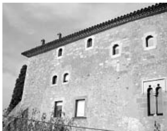
Façana meridional del castell-palau de Sant Mori.