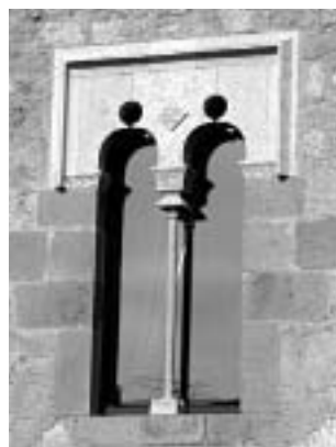
Detall d'una finestra geminada del mur de meridional del castell de Sant Mori. Tot i que és moderna s'ha decorat amb les armes dels Rocabertí, que van ser els hereus del castell un cop s'extingí la família Vilagut.