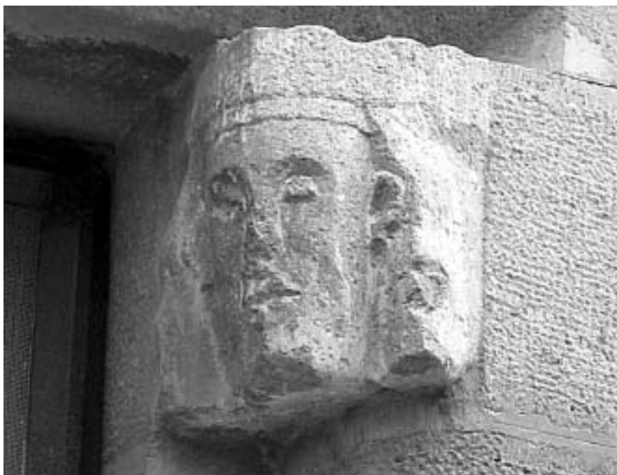
Detall de la finestra de Can Bassas (Castelló d'Empúries, carrer de la Verge).

SOBREQUÉS I VIDAL, Santiago, 1973b: La guerra civil catalana del segle XV , Barcelona: Edicions 62.